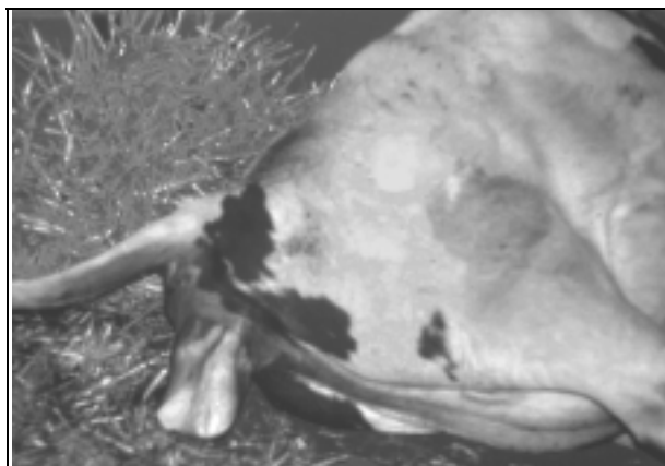
Figura 3: Nacimiento del ternero

Un proceso de involución uterina comienza inmediatamente post parto. El útero reduce su tamaño considerablemente y las capas de tejidos se renovan. Aunque la actividad ovárica puede conducir a la