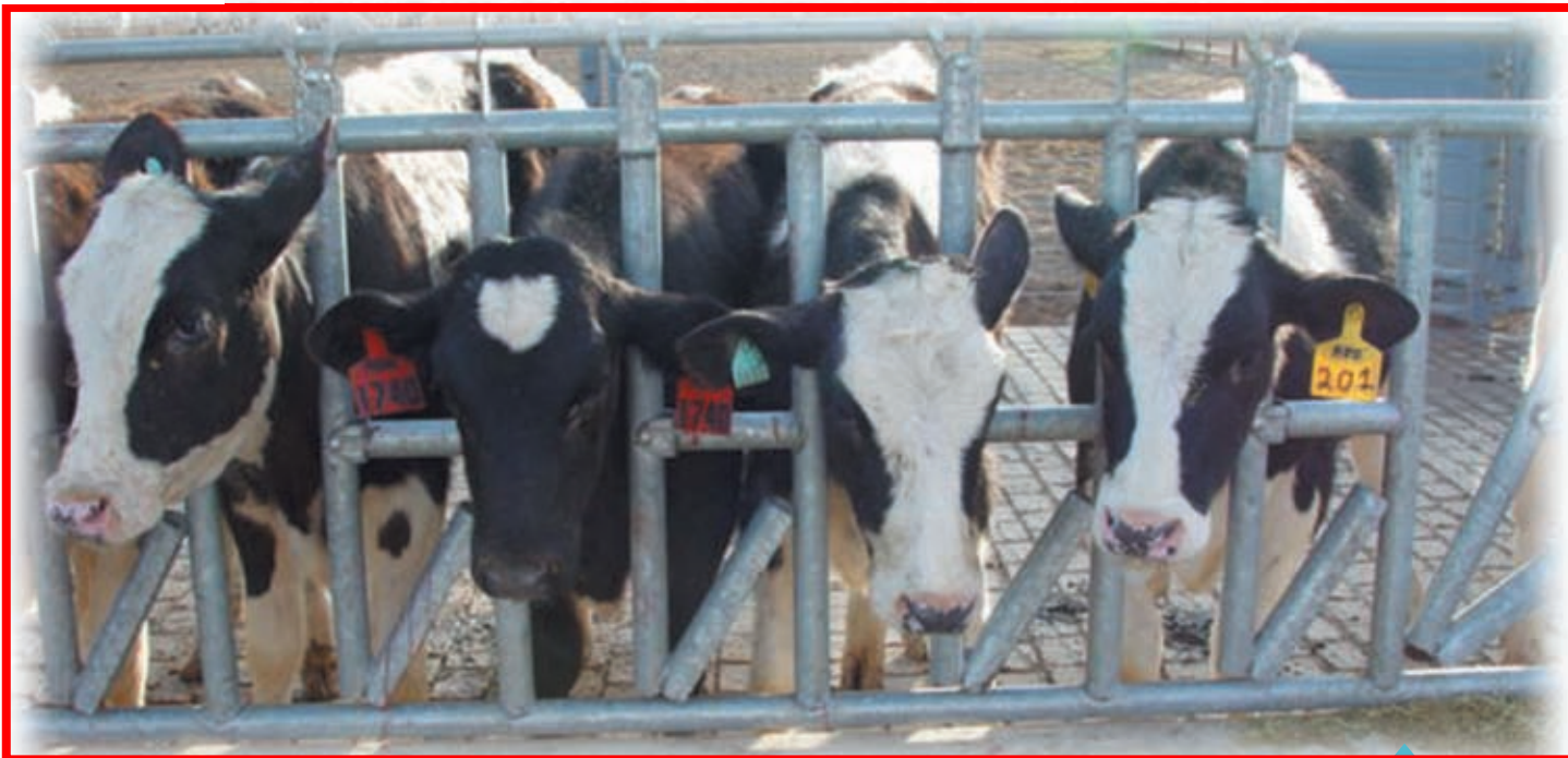
Terneras en collera exterior