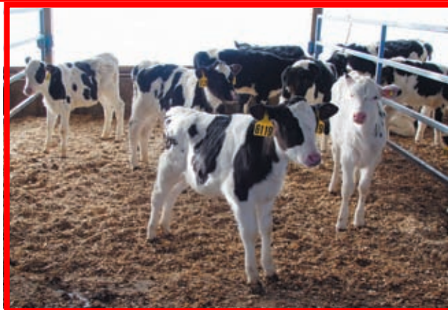
Terneros recién destetados