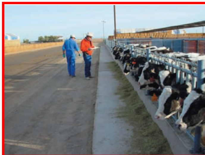
Pesebre abierto con terneras