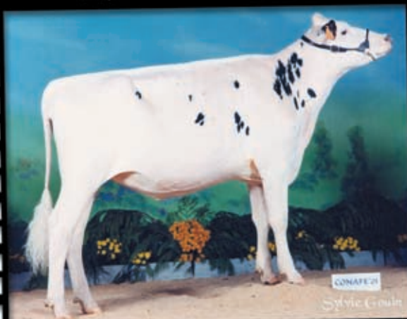
TRAVESÍA PROGRESS LISA Ternera Campeona Nacional 2001 Prop.: SAT Lengusuek (Navarra)