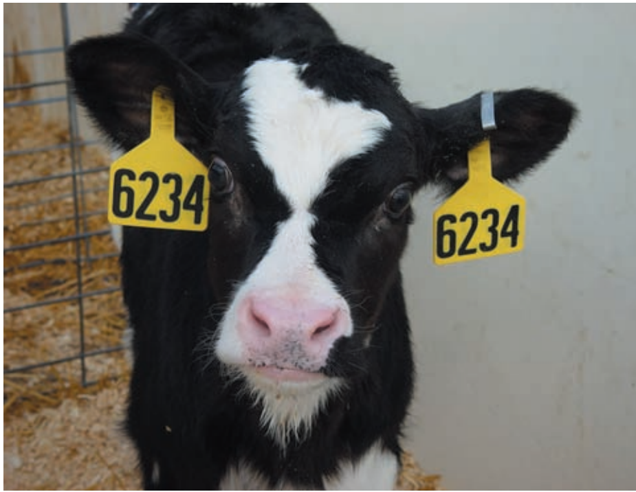
Ternera recién nacida

de la inmunidad transferida mediante la ingestión de calostro en las primeras horas de vida.