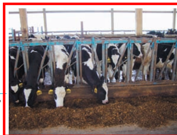
Terneras comiendo en collera