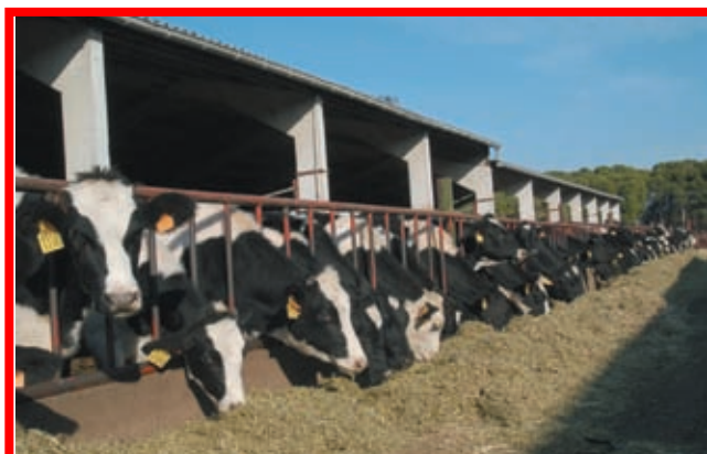
Corral de novillas preñadas