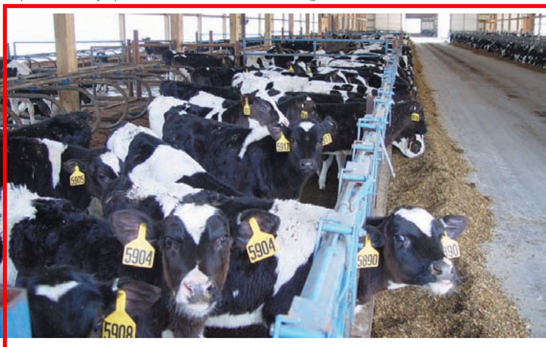
Corral de terneras de 6 meses

1 Avena, cebada o un subproducto de alta energía puede ser utilizado para reemplazar alguna parte o todo el maíz. Todos los ingredientes que no son forrajes pueden ser incluidos en una mezcla de granos.