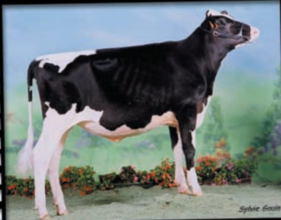
LAZAGA MEL GIBSON Ternera Campeona Nacional 2003 Prop.: Sindicato Mel Gibson

jo apuntan hacia las extraordinarias vacas en que se han convertido y se convertirán al alcanzar la edad adulta. El mayor éxito que obtendremos de nuestro esfuerzo de hoy, al margen de la enorme alegría de triunfar en un Concurso, es garantizar el futuro de nuestro rebaño consiguiendo vacas eficientes, animales con una alta producción y un buen tipo que les permita aprovechar todo su calidad genética y soportar durante muchos años el tremendo impacto de su potencial productivo.