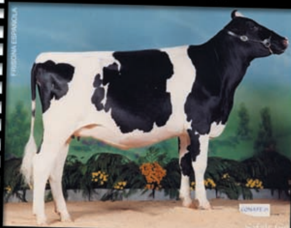
OSASUN LIEUTENANT Novilla Gran Campeona Nacional 2001 Prop.: Finaga (Vizcaya)