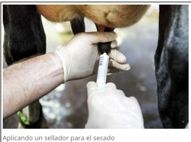
Aplicando un sellador para el secado