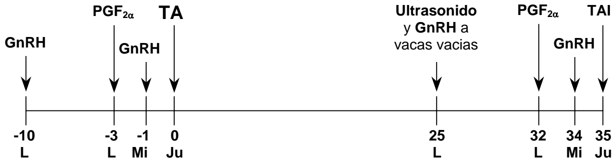
Figura 2. Protocolo de manejo reproductivo que combina IA programada (Ovsynch) con diagnóstico temprano de preñez usando ultrasonido. Nótese que las inyecciones de hormonas son programadas para el lunes (L) y miércoles (Mi), exámenes de ultrasonido para lunes (L), e IA programada (TAI) para el jueves (Ju). El promedio de intervalo entre servicios sería de 35 días para vacas que requieren resincronización.

para resincronización con Ovsynch. Esto resultaría en un intervalo entre servicios de 35 días para vacas que necesiten resincronización.