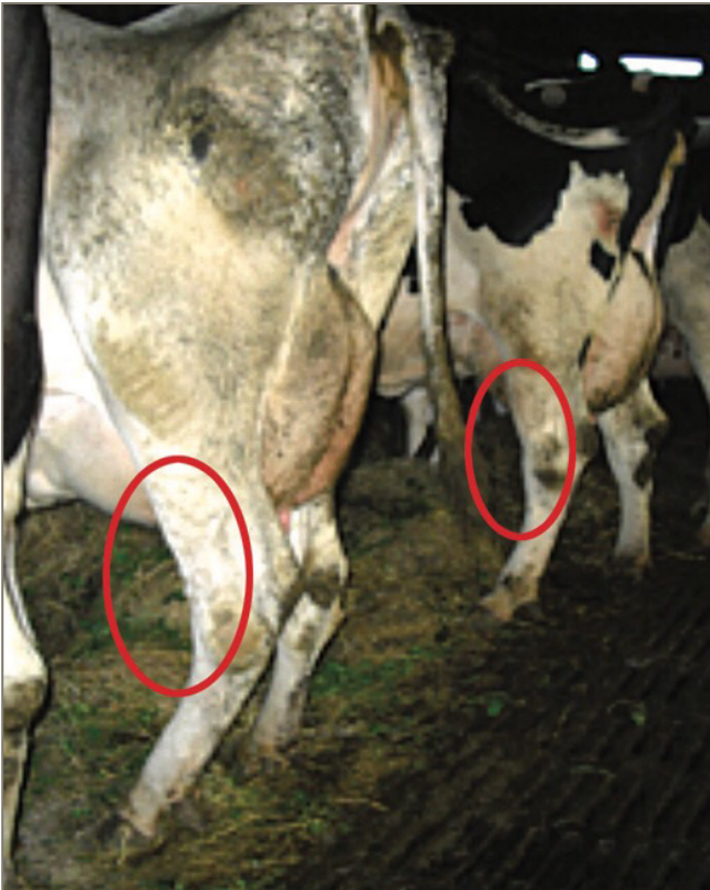
Figura 2: Las lesiones podales se consideran uno de los factores más importantes sobre la repercusión del bienestar.

la ingestión de agua también se reduce, con el cual, disminuye la producción de leche, porque esta depende del consumo de agua. En situaciones de estrés por calor, las necesidades de agua se ven incrementadas mientras que el consumo de materia seca disminuye (NRC, 2001). Además de la cantidad de agua ingerida, la temperatura de esta también influye sobre su consumo, y algunos estudios parecen indicar que la ingestión de agua fresca puede tener un efecto refrigerante en situaciones de estrés por calor (Wilks y col., 1990).