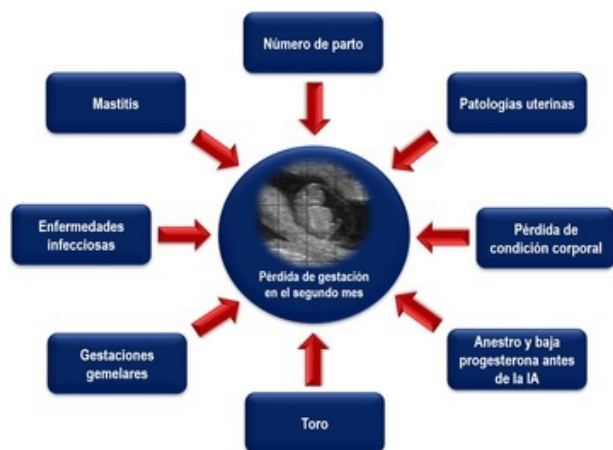
Figura 2. Esquema de los principales factores que influyen en las pérdidas de gestación en el segundo mes (Normal: 12%)

formando parte de todo un complejo de variables o factores que pueden afectar al porcentaje observado de pérdidas (Figura 2).