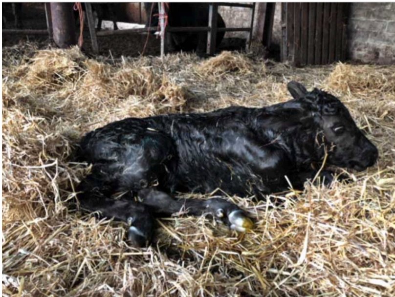
Figure 2. The same calf sat in Figure 1 , in sternal recumbency shortly after delivery by caesarean. Note the clean, dry, deep straw bed it has been placed in.

Esta técnica causa debate entre los veterinarios, con algunos sentimientos de que esto