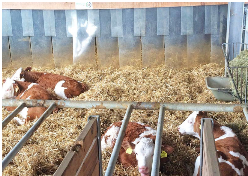
Figura 5. Los métodos para combatir el estrés por frío incluyen áreas protegidas, paja profunda, chaquetas para terneros y protección contra corrientes de aire.

Hay muchos métodos disponibles para intentar combatir el estrés por frío, incluido el uso de áreas protegidas, chaquetas de terneros, paja profunda para anidar y el uso de fardos de paja para evitar corrientes de aire (Figura 5).