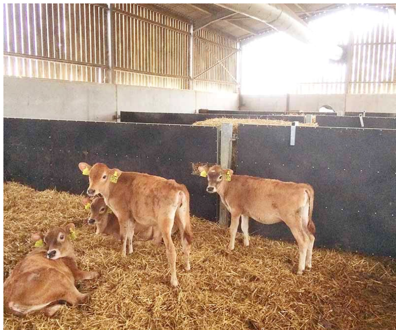
Figura 3. Tubo de ventilación a presión positiva en un cobertizo de terneros para mejorar el flujo de aire

El recuento bacteriano del aire se utiliza como indicador de la calidad del aire, con investigaciones que muestran vínculos entre el aumento de los recuentos bacterianos en