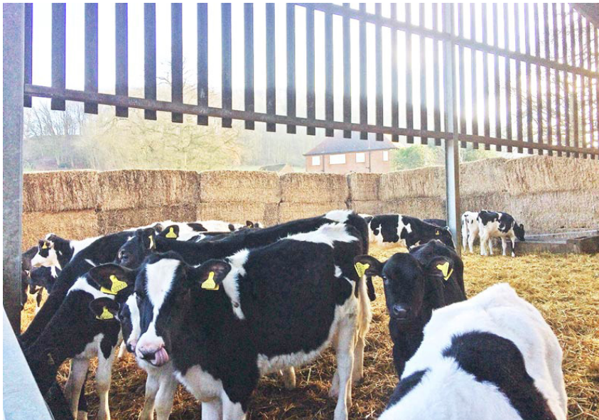
Figura 4. El cobertizo de terneros tiene un área exterior creada con pacas de paja, lo que ayuda a mejorar el flujo de aire y aumenta el espacio disponible en el suelo.

Las altas densidades de población alteran los requisitos de ventilación, con un aumento del doble en la densidad de población que, según se informa, requiere un aumento de diez veces en la capacidad de ventilación para mantener cargas bacterianas patógenas similares. La mejora de la ventilación se puede hacer utilizando ventilación pasiva natural y/o ventilación a presión positiva (PPV).