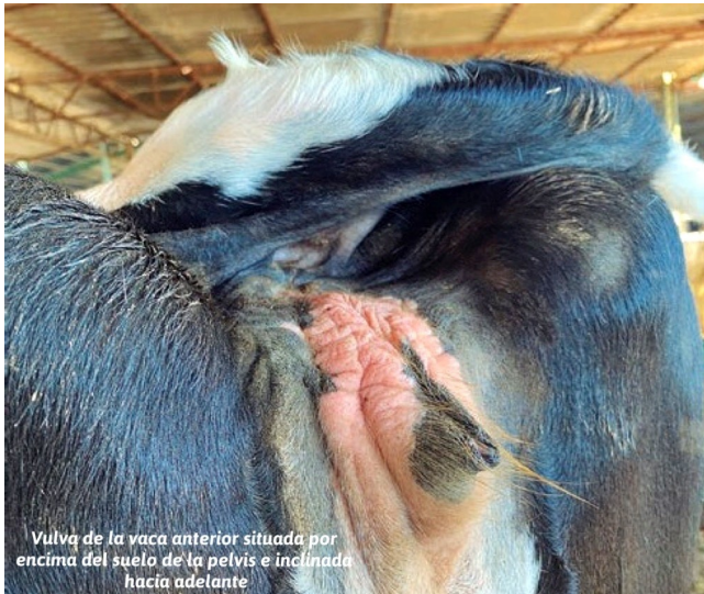
Vulva de la vaca anterior situada por encima del suelo de la pelvis e inclinada hacia adelante

El músculo que eleva y cierra la entrada de la vagina en el momento de la micción es el músculo elevador del vestíbulo vaginal. Este músculo rodea el vestíbulo y se inserta en el sacro. Puede romperse por un parto distócico o hacerlo poco a poco después de varios partos. Por eso esta enfermedad se puede ver en novillas de primer parto, que son las que sufren más casos de distocia, o en vacas multíparas de más edad. Ese músculo solo puede ser explorado examinando el interior del vestíbulo y la vagina, por lo que en las visitas reproductivas rutinarias su integridad no puede ser valorada.