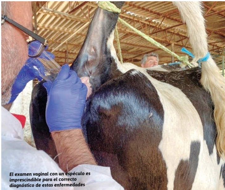
El examen vaginal con un espéculo es imprescindible para el correcto diagnóstico de estas enfermedades

Suponiendo un coste de cría de un novilla de unos 1.800 €, ese coste es el segundo más importante en la producción láctea, solo precedido por el coste de la alimentación, y se amortiza aproximadamente con una lactación y media. Sin embargo, según los trabajos en el Reino Unido de Brickell y Wathes en 2011, el 19% de las vacas no llegan a la segunda lactación. Los daños producidos por el parto, causantes de la neumovagina y urovagina, son más comunes en las novillas primerizas por razones obvias.